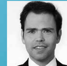
Tim Müller Industrial Goods & High Tech Horváth & Partner GmbH