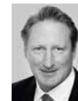
Till Tschierschky Controlling & Finance Horváth & Partner GmbH